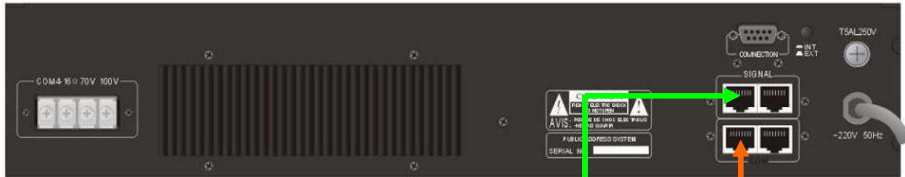
Вход от АТС